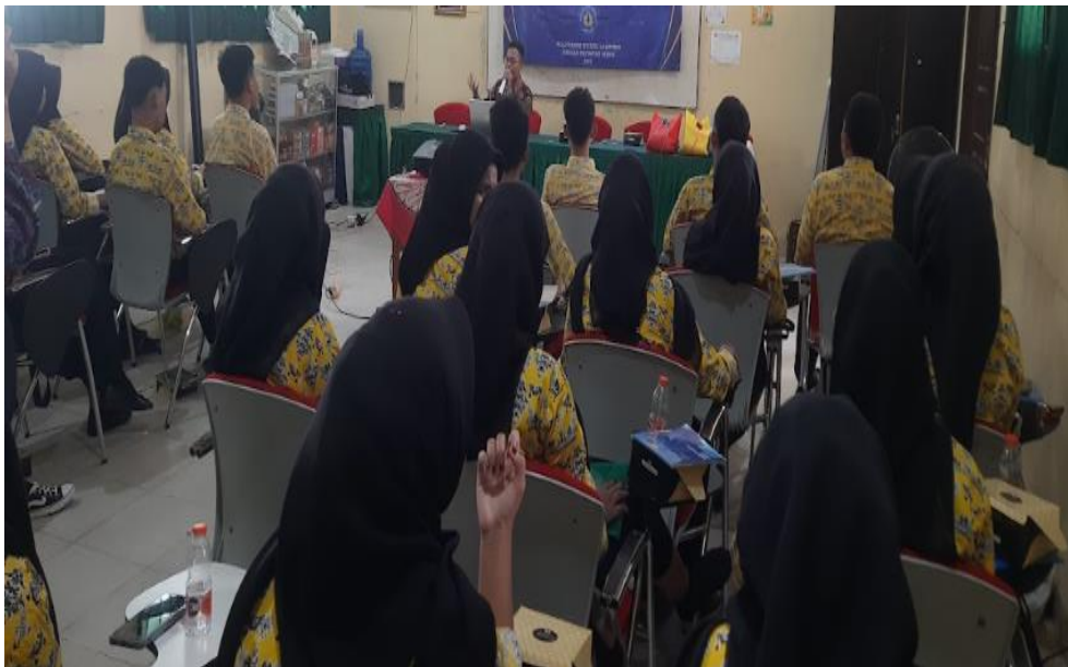
Gambar 2. Pemaparan Materi

capaian konkret peserta. Pertama, terjadi peningkatan kompetensi teknis yang signifikan: seluruh 30 peserta siswa mampu mengoperasikan printer UV flatbed untuk mencetak pada berbagai media (kaos, mug, stiker vinyl) sesuai prosedur keselamatan, menguasai penggunaan software desain (Canva) untuk adaptasi desain berdasarkan brief , serta memahami pengaturan file melalui RIP software . Kedua, pemahaman menyeluruh tentang alur bisnis POD digital terbentuk melalui simulasi proyek; semua kelompok berhasil menjalankan siklus lengkap mulai dari menerima dan memproses "order" simulasi berbasis platform ( Google Form/Spreadsheet ), produksi sesuai spesifikasi, pengemasan, hingga simulasi pemasaran via mock-up e-commerce/media sosial . Ketiga, minat kewirausahaan digital peserta meningkat nyata, diindikasikan oleh 85% peserta menyatakan ketertarikan kuat untuk mengembangkan usaha POD mandiri atau menerapkan keterampilan ini secara profesional, serta munculnya beberapa ide produk inovatif berbasis lokal selama sesi simulasi. Keempat, implementasi Teaching Factory mengalami penguatan substantif melalui integrasi langsung model bisnis POD digital ke dalam lingkungan praktik sekolah, menghasilkan lebih dari 50 produk cetak berkualitas sebagai bukti nyata pembelajaran. Secara keseluruhan, kegiatan ini sukses meningkatkan kesiapan siswa menghadapi tuntutan industri percetakan modern.