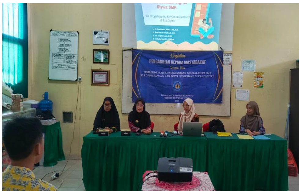
Gambar 3. Sesi Diskusi

Keberhasilan pelatihan Teaching Factory Print on Demand (POD) berbasis digital di SMK Negeri 7 Bandar Lampung dalam meningkatkan kompetensi teknis, pemahaman bisnis, dan minat kewirausahaan siswa memperkuat temuan sebelumnya tentang efektivitas pendekatan praktis berbasis proyek dalam pendidikan vokasi (Fadillah et al., 2021), namun memberikan kontribusi spesifik pada konteks POD digital yang sebelumnya belum terakomodasi maksimal dalam implementasi Tefa sekolah. Peningkatan signifikan dalam penguasaan alat seperti printer UV dan software Canva membuktikan bahwa paparan langsung dan praktik intensif dengan teknologi mutakhir, disertai pendampingan teknis, merupakan kunci percepatan literasi digital siswa SMK mengatasi kesenjangan alat-alat konvensional yang selama ini diajarkan sebagaimana diidentifikasi dalam observasi awal (Sari & Yanto, 2025).